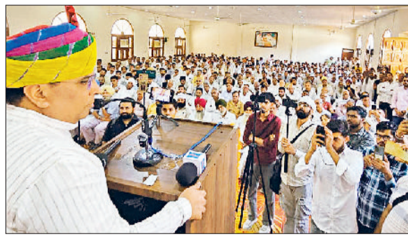
सिरसा। भाईचारा स्नेह सम्मेलन को संबोधित करते पूर्व वित्तमंत्री कैप्टन अभिमन्यु।