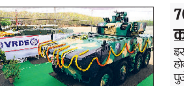
नई दिल्ली। भारतीय सेना अब पहले से कहीं ज्यादा ताकत और आधुनिक होने जा रही है। भविष्य के युद्धों की जरूरतों को देखते हुए रक्षा अनुसंधान एवं विकास संगठन (डीआरडीओ) ने एक खास बख्तरबंद प्लेटफॉर्म तैयार किया है। इसे विशेष रूप से वाहन अनुसंधान एवं विकास प्रतिष्ठान (वीआरडीई), द्वारा डिजाइन और विकसित किया गया है।