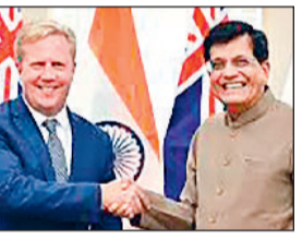
करेना और अगले 15 वर्षों में 20 अरब डॉलर का निवेश जाएगा। दोनों देशों ने पिछले साल 22 दिसंबर को व्यापार समझौते के लिए बातचीत पूरी होने की

भारत और न्यूजीलैंड 27 अप्रैल को मुक्त व्यापार समझौते (एफटीए) पर हस्ताक्षर करेंगे। वाणिज्य मंत्रालय के अनुसार इस समझौते पर केंद्रीय वाणिज्य एवं उद्योग मंत्री पीयूष गोयल और न्यूजीलैंड के व्यापार एवं निवेश मंत्री टॉड मैकले की उपस्थिति में यहां भारत मंडपम में हस्ताक्षर किए जाएंगे। यह समझौता भारतीय कंपनियों को न्यूजीलैंड के बाजारों में शुल्क मुक्त पहुंच प्रदान