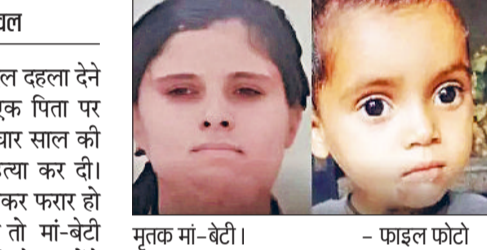
मृतक मां-बेटी।