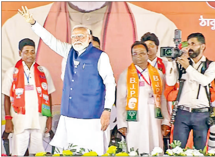
कोलकाता में प्रधानमंत्री का रोड शो

मोदी ने मनुआ समुदाय के मुख्य मंदिर, कोलकाता के टनटनिया काली मंदिर में प्रार्थना की। पश्चिम बंगाल विधानसभा चुनाव के दूसरे और अंतिम चरण से पहले भाजपा ने अपना प्रचार अभियान तेज कर दिया है और इसी क्रम में प्रधानमंत्री मोदी ने रविवार को उत्तरी कोलकाता में एक रोड शो किया। 'भारत माता की जय', 'जय श्री राम' और भाजपा के पश्चिम बंगाल चुनाव के नारे 'पलटने दरकार, तेई भाजपा सरकार' (परिवर्तन लाने के लिए भाजपा सरकार जरूरी है) के नारों के बीच, रोड शो की पाल पालेवैव्य से शुरू हुआ और शोभा बाजार होते हुए खन्ना क्रॉसिंग पर समाप्त हुआ। दो किमी दूरी तय करने वाले रोडशो में सड़क के दोनों ओर समर्थकों की भीड़ नजर आई। मोदी ने ठाकुरनगर में राजनीतिक रूप से प्रभावशाली मनुआ समुदाय के मुख्य मंदिर ठाकुरबाड़ी और कोलकाता के ऐतिहासिक ठनटनिया काली मंदिर में पूजा-अर्चना की।