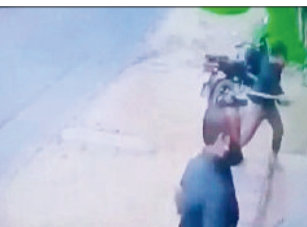
बंगाल में टीएमसी का गुंडा राज चल रहा: राहुल

कोलकाता (भाषा)। पश्चिम बंगाल में दूसरे चरण के चुनाव से पहले डायमंड हार्बर विधानसभा क्षेत्र में बाइक पर सवार कुछ लोगों द्वारा स्थानीय लोगों को धमकाने का एक वीडियो सोशल मीडिया पर सामने आने के बाद निर्वाचन आयोग ने रविवार को जांच के आदेश दिए। एक वरिष्ठ अधिकारी ने यह जानकारी दी। मामला सामने आते ही निर्वाचन आयोग ने डायमंड हार्बर थाने में औपचारिक शिकायत दर्ज कराई। अधिकारियों ने बताया कि मामला दर्ज कर लिया गया है और जांच शुरू कर दी गई है। अधिकारी ने बताया, "निर्वाचन आयोग इन मामलों को रोकने के लिए कदम उठा रहा है। राज्य में 29 अप्रैल को होने वाले विधानसभा चुनाव के दूसरे चरण के लिए प्रचार सोमवार शाम को समाप्त हो जाएगा।